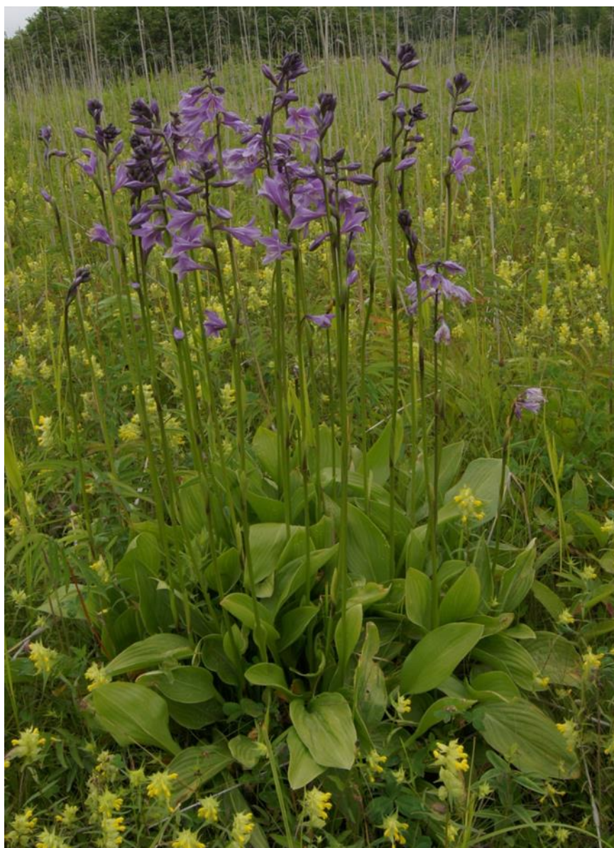
Hosta rectifolia Nakai