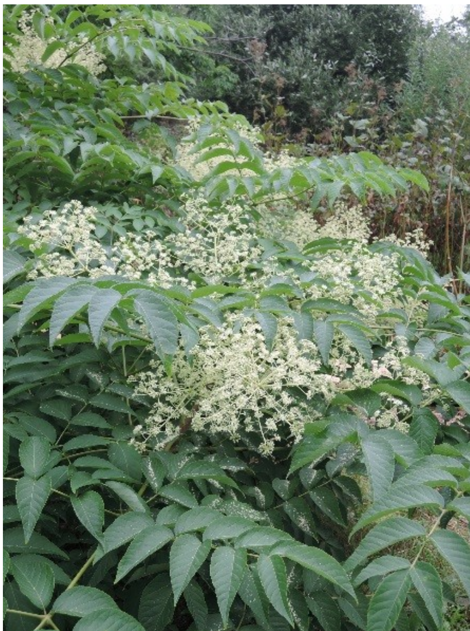
Aralia elata (Miq.) Seem.