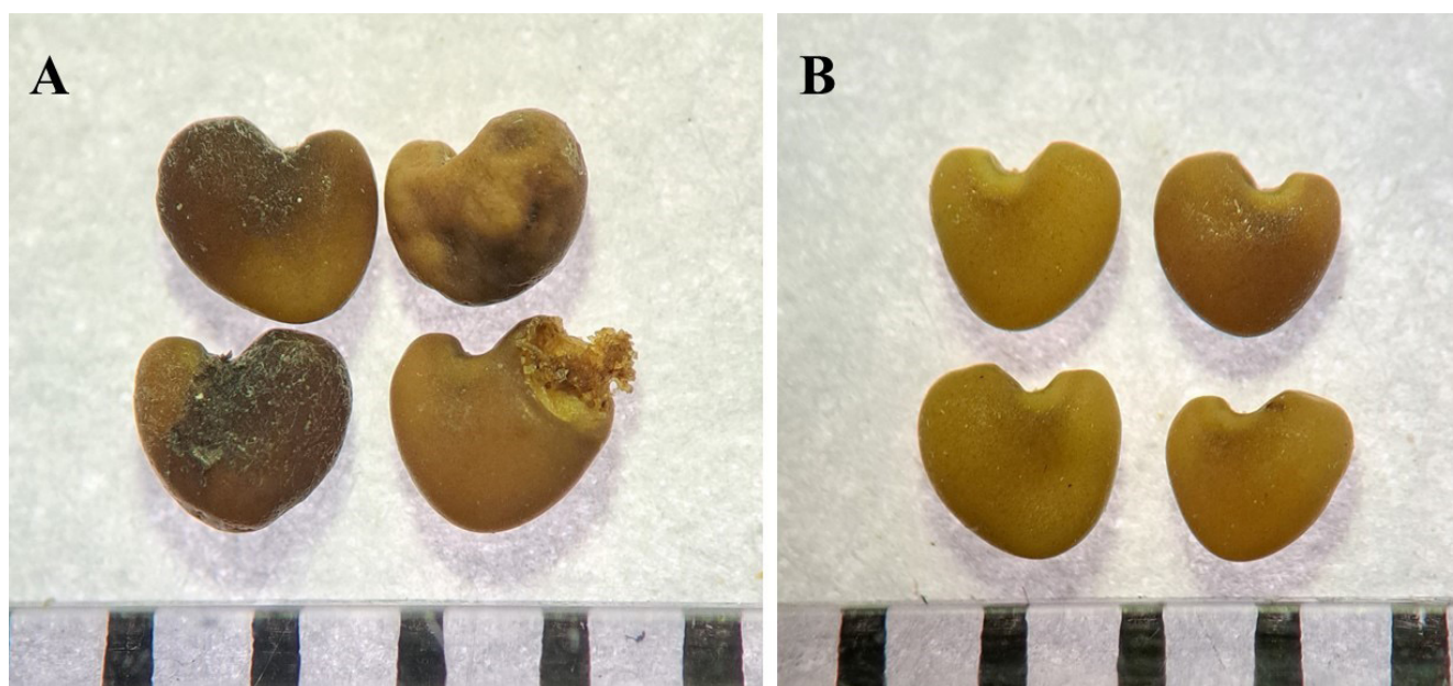
Рисунок 1. Микроскопическое исследование семян Astragalus uliginosus L. (масштабная линейка равна 1 мм): А — повреждённые, В — пригодные к работе.

Figure 1. Microscopic observation of Astragalus uliginosus L. seeds (scale bar = 1 mm): A — damaged seeds, B — seeds suitable for use.