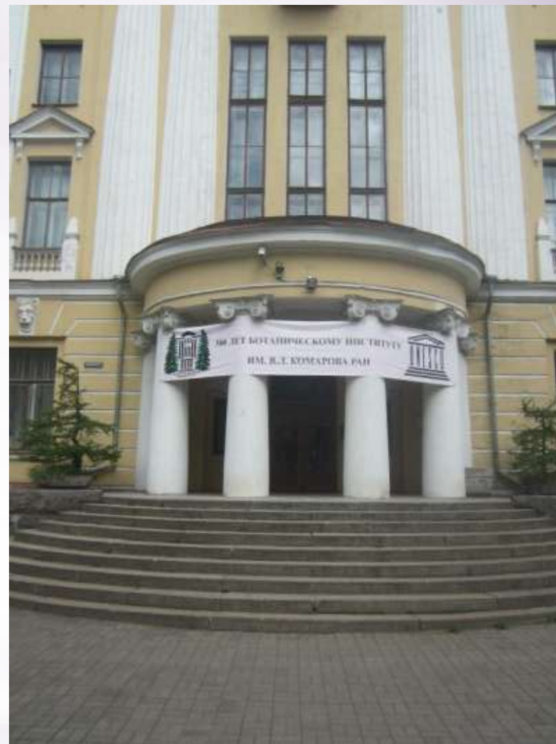
Ботанический институт имени В.Л. Комарова РАН