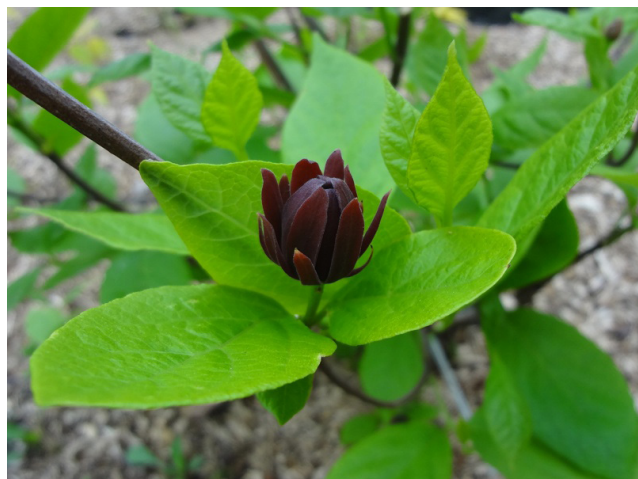
Рисунок 1. C. floridus в стадии цветения.

Североамериканский род Calycanthus L. (сем. Calycanthaceae Lindl.) включает четыре вида: C. brockianus Ferry et Ferry f., C. chinensis (W.C. Cheng et S.Y. Chang) P.T. Li, C. floridus L., C. occidentalis Hook. et Arn. (Bingtao, Bartholomew, 2008). Все перечисленные виды являются ценными декоративными растениями, благодаря чему получили широкое распространение в садах Европы, Америки и Восточной Азии. В России C. floridus — каликант цветущий (Рис. 1) известен только в коллекциях на юго-западе страны, в том числе в условиях закрытого грунта (Drevesnyue rasteniya..., 2005; Svyazeva, 2005). Этот вид вызывает интерес, как наиболее морозоустойчивый представитель рода. Относится к кустарникам с полностью одревесневающими удлинёнными побегами. Скелетные ветви ортотропные, формирующие округлую крону 2–3 м высотой. Жизненную форму можно определить как высокий гипогеогенно-геофильный кустарник: небольшое количество подземнообразующихся основных скелетных осей примерно одинакового возраста. Вид относится к вегетативно подвижным кустарникам за счет формирования корневых отпрысков. Листья простые эллиптические 15–20 см длиной. Цветки терминальные, диаметром до 7 см, на ко-