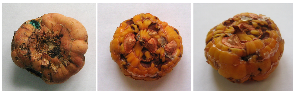
Figure 3. Gladiolus corms affected by bacterial scab ( Pseudomonas marginata (Mc Cull.) Stapp.)