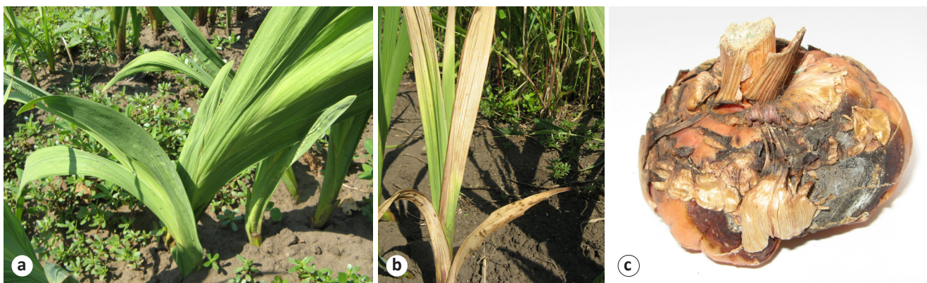
Рисунок 1. Поражение растений (a, b) и клубнелуковиц (c) сухой фузариозной гнилью ( Fusarium oxysporum Schltdl. f. gladioli (Massey) W.C. Snyder et H.N. Hansen).

Figure 1. Damage to plants (a, b) and corms (c) by dry fusarium rot ( Fusarium oxysporum Schltdl. f. gladioli (Massey) W.C. Snyder et H.N. Hansen).