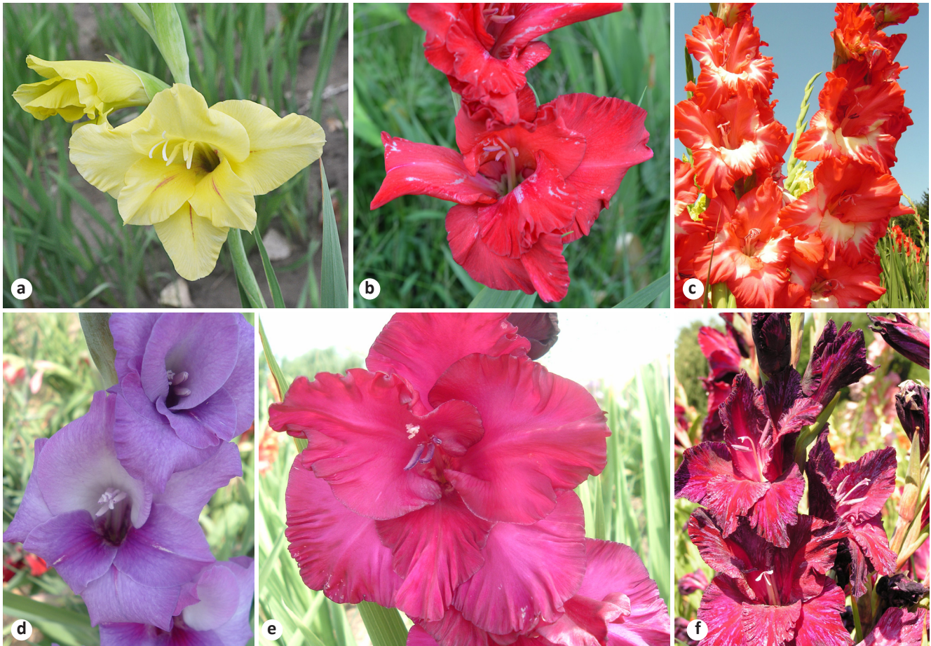
Рисунок 6. Воздействие трипсов на сорта гладиолуса: а) ‘Gold Wave’; б) ‘Waldorf’; в) ‘Гамма’; д) ‘Паминклас Партизанам’; е) ‘Судьба’; ф) ‘Black Stallion’.