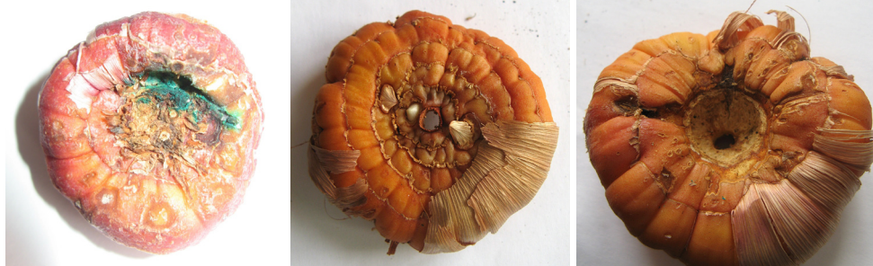
Рисунок 3. Клубнелуковицы гладиолусов, пораженные бактериальной паршой ( Pseudomonas marginata (Mc Cull.) Stapp.)

Figure 2. Gladiolus corms affected by brown core rot ( Botrytis gladiolorum Timmerm.)