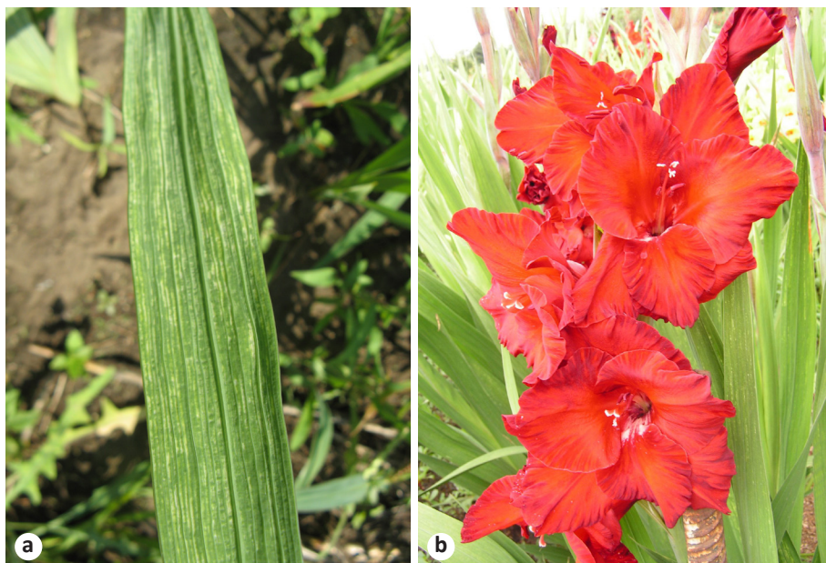
Figure 5. Gladiolus plants affected by viral pathogens ( Gladiolus mosaic virus , Jellow mosaic virus ): (a) leaves; (b) flowers.

вирусными заболеваниями: гладиолусовые мозаики ( Gladiolus mosaic virus ) и гладиолусовые желтухи ( Jellow mosaic virus ) (Рис. 5).