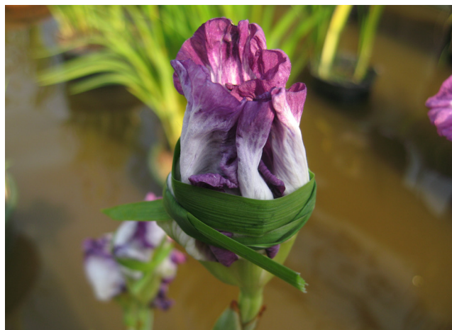
Рисунок 1. Изоляция цветка Figure 1. Flower isolation

Сорта, имеющие цветки с опущенными наружными долями околоцветника (фолами), как правило, имеют меньшую ширину цветка, но часто цветок измеряют в распластанном виде, за счет чего его ширина значительно увеличивается (Рис. 2). Сорта Pseudata и гибриды, в том числе, имеют опущенные или полуопущенные фолы. Внутренние доли околоцветника (стандарты) узкие и смотрят вверх.