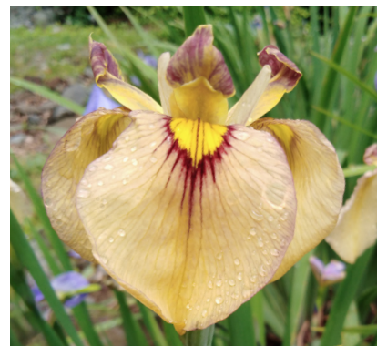
Рисунок 7. Гибрид 3.6.16