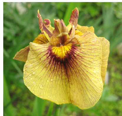
Figure 4. Hybrid 1.5.16

В результате изучения и анализа полученных гибридов для дальнейшей работы были отобраны всего 6 гибридов. Они имели по 1–2 цветоносу с 2–3 цветками на каждом. Период цветения в зависимости от года наблюдений находился в пределах 2 декады июля.