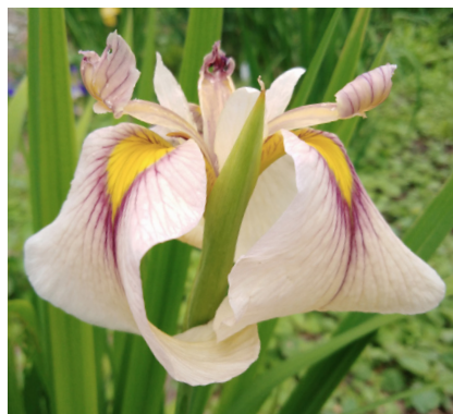
Рисунок 5. Гибрид 1.6.16

3.6.16. Гибрид 59.4 см высотой с 1 генеративным и 2 вегетативными побегом. Цветок шириной 5.7 см, 4.8 см длиной. Фолы палево-желтые, с сиреневыми жилками и тонкой каймой по краю лепестка. Ярко-желтый сигнал в пурпурной кайме с длинными «ресничками» того же цвета. Стандарты длинные 2.5 см желтые, узкие. Лопасты столбика светло-желтые с закрученными коричневыми гребнями (Рис. 7).