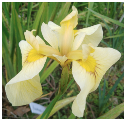
Рисунок 4. Гибрид 1.5.16