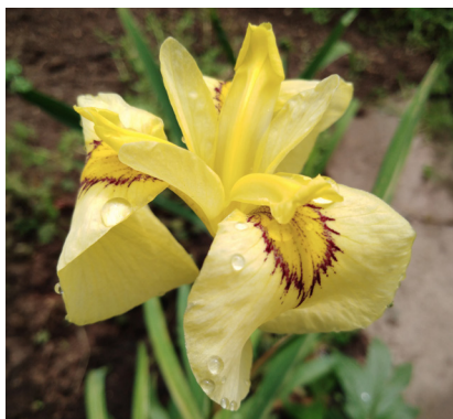
Рисунок 6. Гибрид 1.10.17