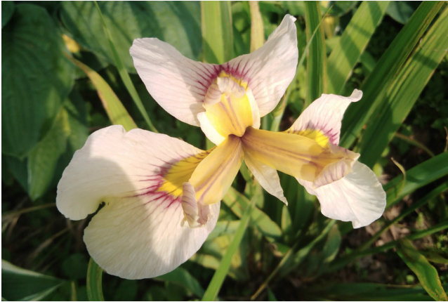
Рисунок 8. Гибрид 4.5.16